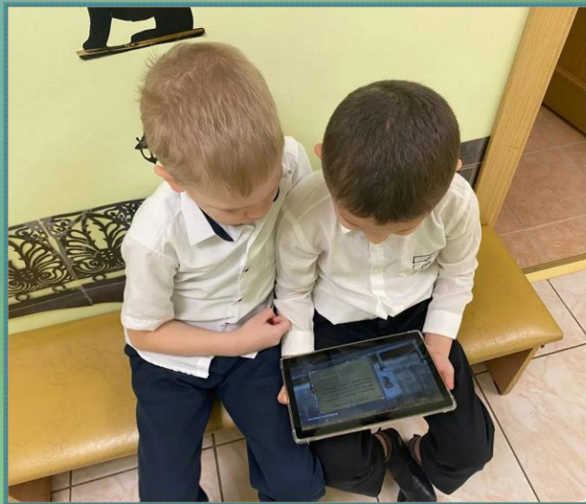
Интерактивное занятие во вне групповом пространстве «Идет по городу трамвай. Животные блокадного Ленинграда» с детьми подготовительных к школе групп № 4 и 10