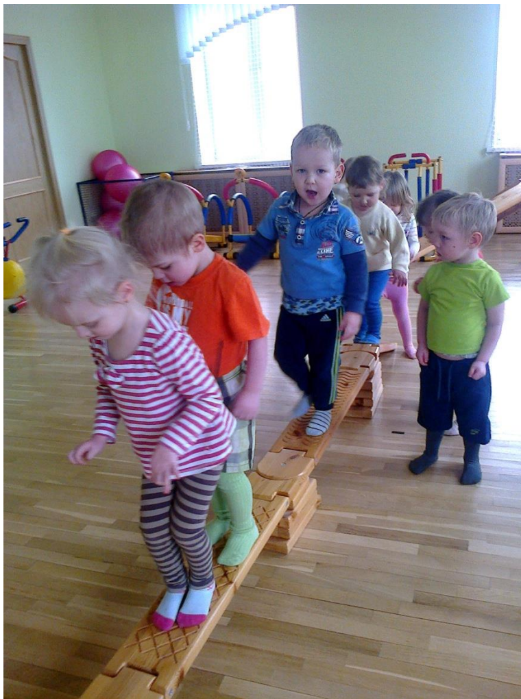
Занимаемся в спортивном зале.