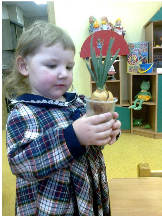
Наблюдаем за росточками лука,