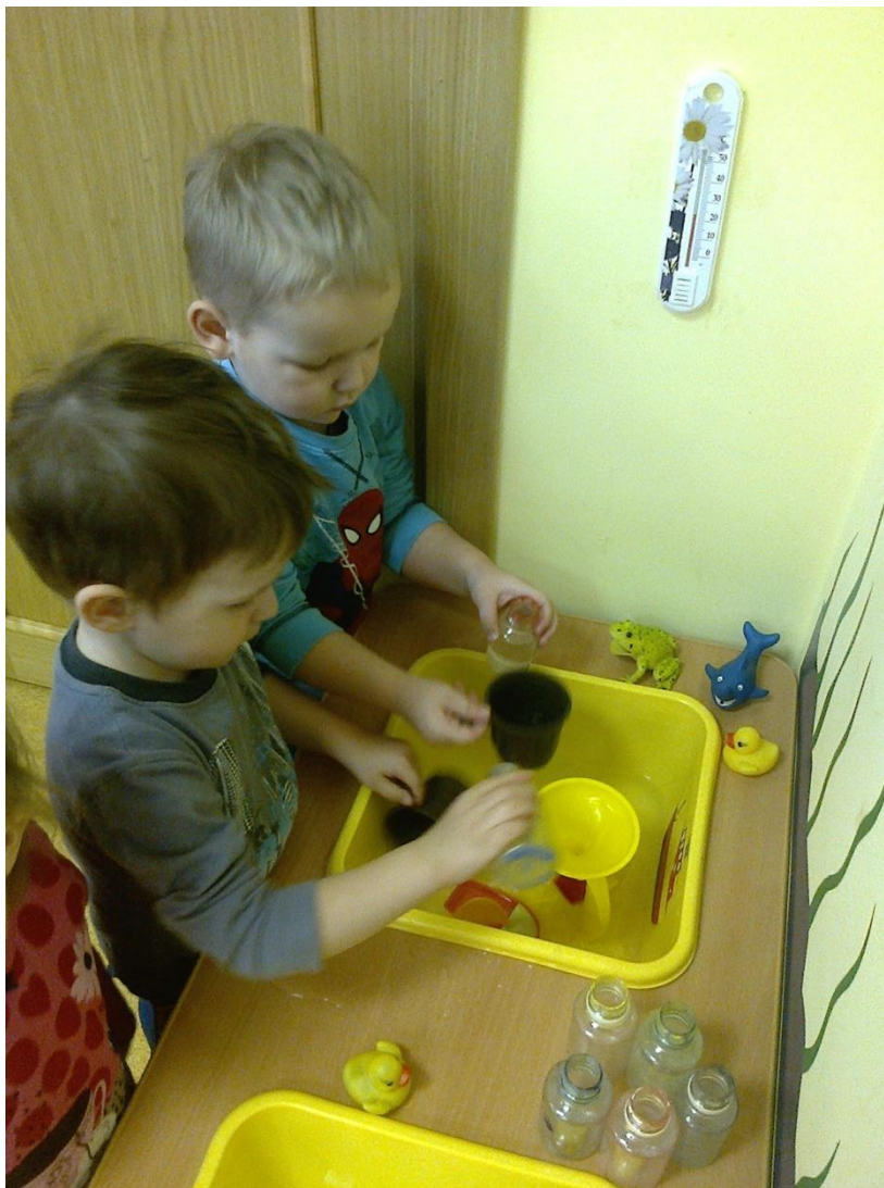
Ставим эксперименты с водой,