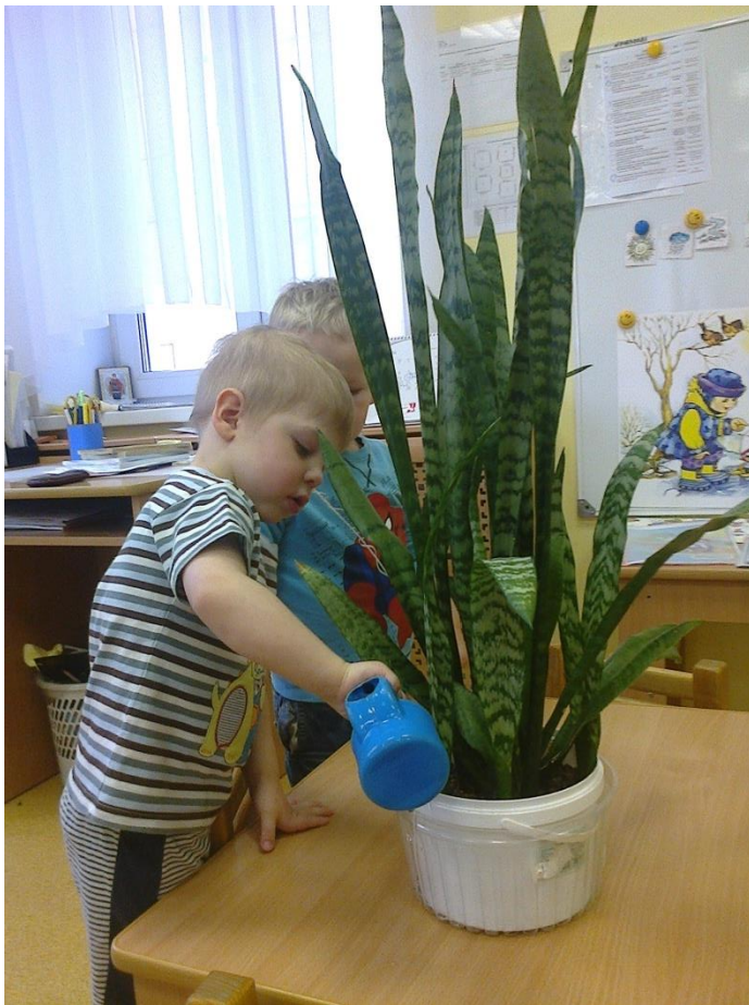
Ухаживаем за комнатными растениями,